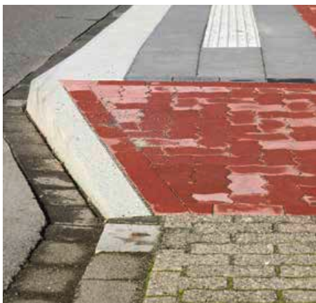
Für Blinde und sehbehinderte Menschen sind Rillenplatten im Boden angebracht.

Nach anfänglichem Rückgang der Fahrgastzahlen durch den ersten Lockdown von bis zu 40 Prozent wurden die Busse bis etwa Mitte Oktober wieder gut genutzt. Die Auswirkungen aufgrund der neuerlichen Einschränkungen im öffentlichen Leben haben diese positive Entwicklung leider wieder gegenteilig beeinflusst. Der Kauf der Tickets beim Fahrpersonal ist jedoch durch Umrüsten der Busse mit einer Schutzscheibe für das Fahrpersonal seit Juni wieder möglich. Zudem wurden als Service insbesondere für ältere Fahrgäste ohne Zugang zum Internet während des ersten Lockdowns per Telefon bestellte Tickets auf Rechnung an die Fahrgäste versendet, um dadurch auch ohne die Nutzung von Ticketapps mobil zu bleiben. ■